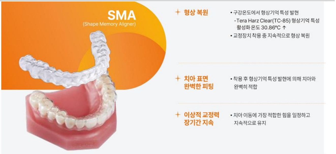
그림 1. 구강온도에서 형상이 복원되는 투명 형상기억 교정기